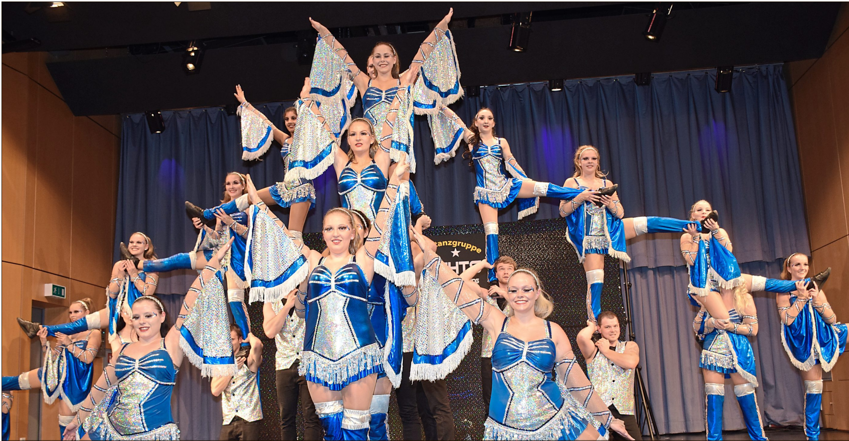
„Wir sind der Höhepunkt Ihrer Veranstaltung“ lautet das Motto der Showtanzgruppe. Mit mehrstufigen und fulminanten Hebefiguren ging es auch auf der Bühne wirklich hoch hinaus.