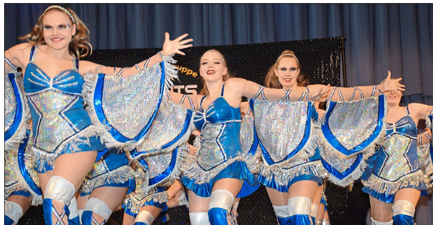
Energiegeladen, starker Ausdruck und Leidenschaft beim Tanzen auf sehr hohem Niveau – das sind die „Starlights“.